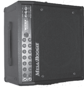
Git 2 Amp